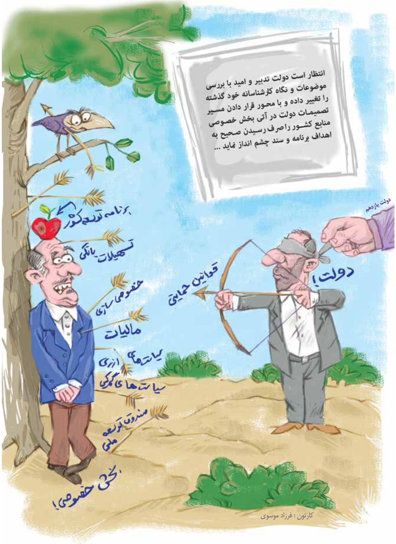
کارتون : فرزاد موسوی