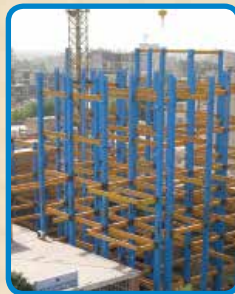
پروژه ساختمان اتاق بازرگانی