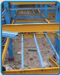
عملیات نصب تیرهای فرعی