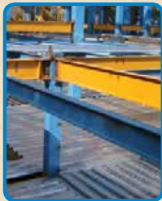
اجرای سقف عرشه فولادی