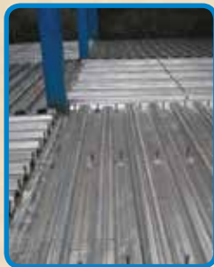
عملیات نصب گل میخ (برش گیر)