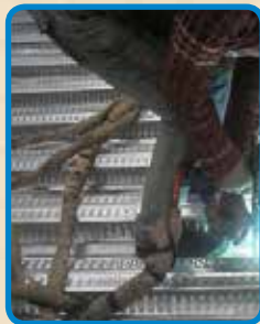
عملیات نصب برش گیر سقف