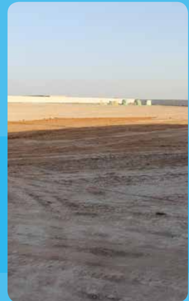
بازدید رئیس اتاق اهواز و هیئت همراه به چذابه